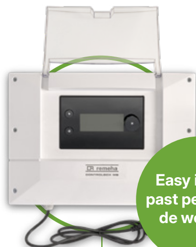
ControlBox MB regelaar

Easy install, past perfect in de woning.