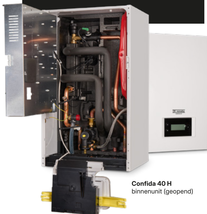
Confida 40 H binnenuit (geopend)