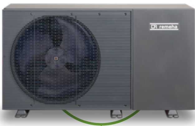
Confida MB 400 buitenunit