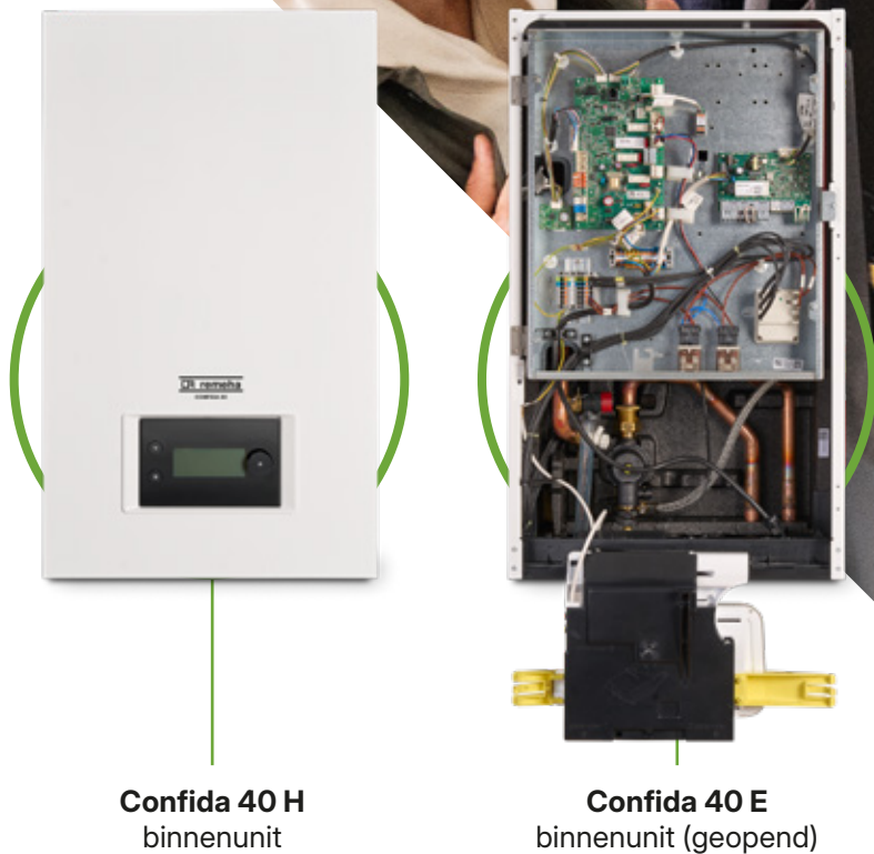
Confida 40 H binneneenheid